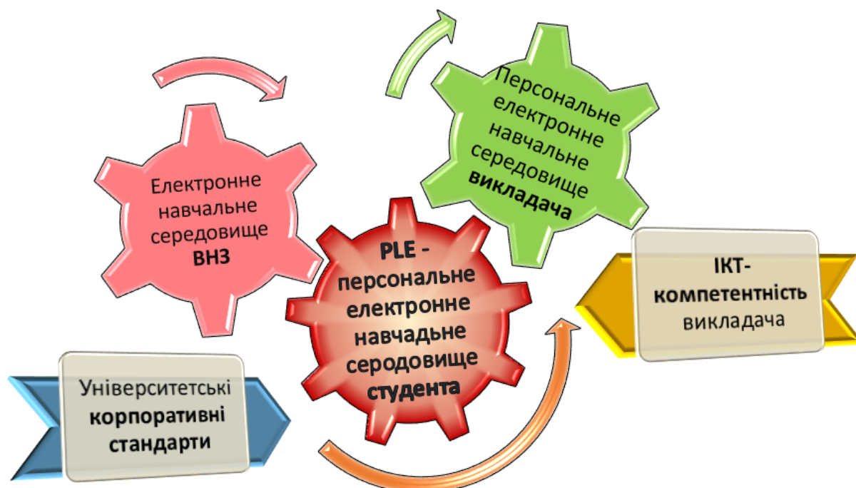
Рис. 1. Віртуальне освітнє середовище сучасного студента

Головною метою підготовки фахівця у соціально-економічних умовах інформаційного суспільства стає не здобуття ним кваліфікації у вибраній вузькоспеціальній сфері, а набуття та розвиток певних компетентностей, які мають забезпечити йому можливість адаптуватися в умовах динамічного розвитку сучасного світу. Зазначимо, що компетенцію, ми розглядаємо, як сукупність взаємопов'язаних якостей особистості (знань, умінь, навичок, способів діяльності) щодо певного кола предметів і процесів, необхідних для якісної продуктивної діяльності. Компетентність — володіння особистістю певною компетенцією чи їх сукупністю, що включає її особисте ставлення до компетенції та предмета діяльності. Тоді, з огляду на активне використання ІКТ у всіх сферах людської діяльності, зокрема в освіті, постала необхідність виокремлення ІКТ-компетентності в загальній структурі особистісно-професійного профілю педагога та впровадження компетентнісного підходу, який акцентує увагу на результатах освіти, причому результатами вважається не сукупність засвоєної інформації, а здатність людини діяти в різноманітних проблемних ситуаціях.