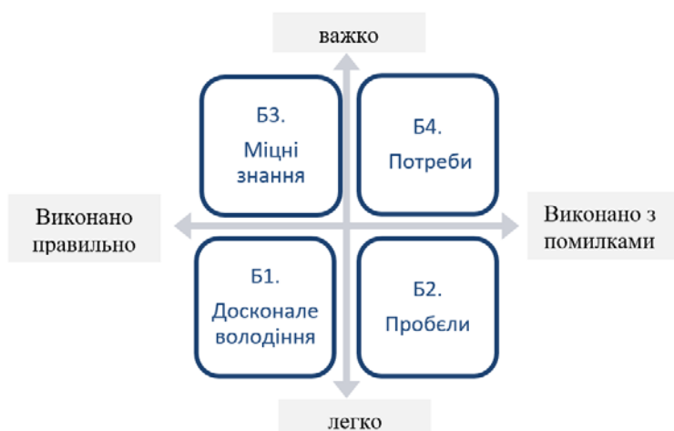
Рис. 1. Схема аналізу відповідей учнів для подання зворотного зв'язку

Сьогодення вимагає формалізувати зворотний зв'язок таким чином, щоб на основі виконаних завдань, учень, сидючи за комп'ютером, отримав не просто «правильно»-«неправильно» або бальну оцінку, а розгорнутий відгук, з якого дізнався про свою дислокацію на шляху свого просування до навчальної цілі. У курсах на платформах МВОК (наприклад, Moodle), які можуть бути як абсолютно незалежними онлайн курсами так і бути вбудованими у системи навчальних курсів «цегляних» університетів, є можливість планувати зворотний зв'язок. Для з'ясування умов, за яких інформування учня буде найбільш корисним для його навчання, розглянемо модель, запропоновану Г. Брауном (Gavin T L Brown) [6] і подану на Рис. 1. Намагаючись, знайти відповідні підписи-назви кожного блоку, ми орієнтувалися не стільки на точність перекладу слів, скільки на відповідність їх сутності, тому ця схема являє собою певну інтерпретацію авторської моделі до розуміння українською аудиторією. У такій спосіб створена схема дозволяє побудувати якісний зворотний зв'язок відповідно до того, як (правильно чи неправильно) учень впорався з легкими та важкими завданнями, тобто до якого блоку можна віднести результати його діяльності.