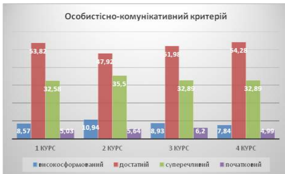
Рис.1. Результати діагностики рівня готовності до партнерської взаємодії за особистісно-комунікативним критерієм

Результати рівня готовності до партнерської взаємодії за особистісно-комунікативним критерієм були визначені за допомогою таких методик: Методика діагностики комунікативної установки за В.В. Бойком (визначення загальної комунікативної толерантності), Методика визначення емпатійності (опитувальник А. Мехрабіана і Н. Епштейна), Опитувальник «Рівень суб'єктивного контролю» (шкала інтернальності), Тест-опитувальник організаторських і комунікативних здібностей майбутнього педагога (за Федоришиним) [7].